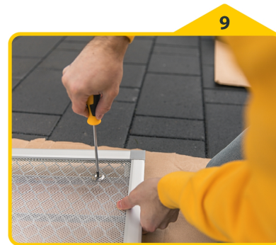
9 Lichtschachtrahmen mit Hilfe der beiliegenden Befestigungsschrauben auf der Abdeckung des Lichtschachtes fixieren..