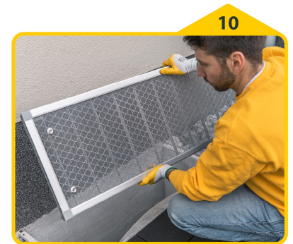
10 Gesamte Einheit wieder auf den Lichtschacht setzen.