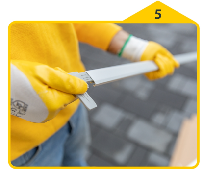
5 Die Eckverbinder in die Profile schieben und mithilfe eines Gummihammers einschlagen.