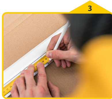
3 Kürzungsmaße auf die Rahmenprofile übertragen.