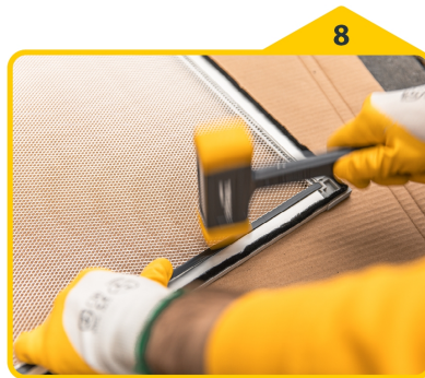
8 Gewebe mit Schlagkeder und Gummihammer fixieren.