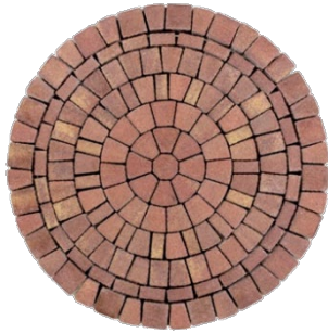
Ø 168 x 6 cm